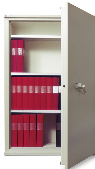
Dokumentskab FireSafe BDA 210