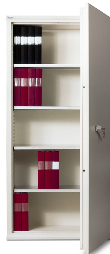
Dokumentskab FireSafe BDA 310