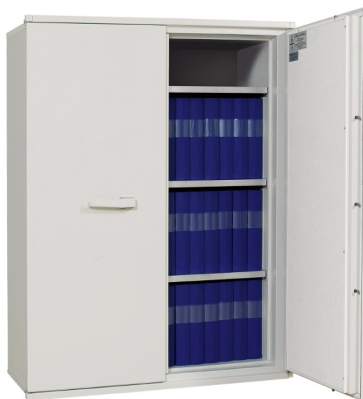
Dokumentskab FireSafe BDA 390

Indretningerne er nemme at sætte i skabene og kan naturligvis flyttes, hvis dette ønskes. FireSafe BDA 210 og BDA 310 har kun én dør som leveres højre hængslet som standard (kan også leveres venstre hængslet).