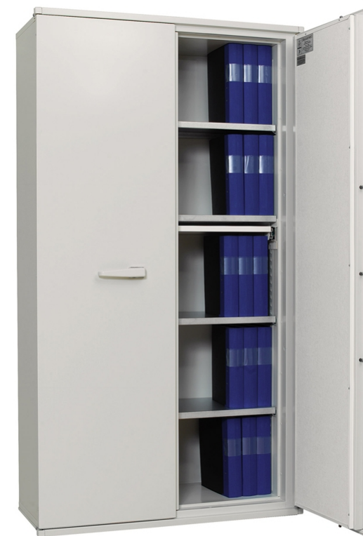
Dokumentskab FireSafe BDA 580