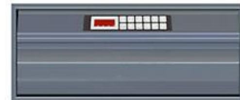
CashSafe T MultiSafe